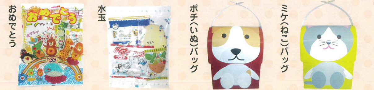
■合掌タイプ ヨコ180×タテ240mm ■合掌タイプ ヨコ150×タテ200mm ■化粧箱 巾111×奥行76×高137+取手42mm ■化粧箱 巾111×奥行76×高137+取手42mm