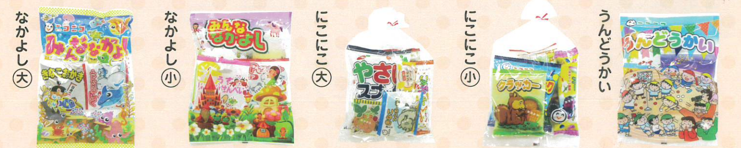
■合掌タイプ ヨコ200×タテ290mm ■合掌タイプ ヨコ180×タテ240mm ■巾着タイプ ヨコ200×タテ350mm ■巾着タイプ ヨコ180×タテ320mm ■合掌タイプ ヨコ180×タテ240mm